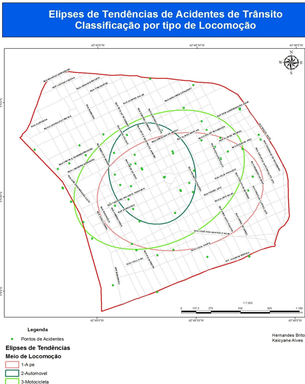
Figura 3 – Elipses de tendências de acidentes de trânsito, classificação por tipo de locomoção.

A figura 3 apresenta as elipses criadas a partir do meio de locomoção dos envolvidos nos acidentes. Percebe-se que os automóveis, representados pela elipse de cor verde, estão mais concentrados na região central, no sentido norte-sul. Os acidentes com os motociclistas estão mais distribuídos, no sentido da Zona Leste, sendo estes as maiores vítimas em acidentes de trânsito, somando 56 vítimas. Os acidentes com pedestres estão distribuídos no sentido da Zona Sul, só que em menos número de vítimas, somando 6.