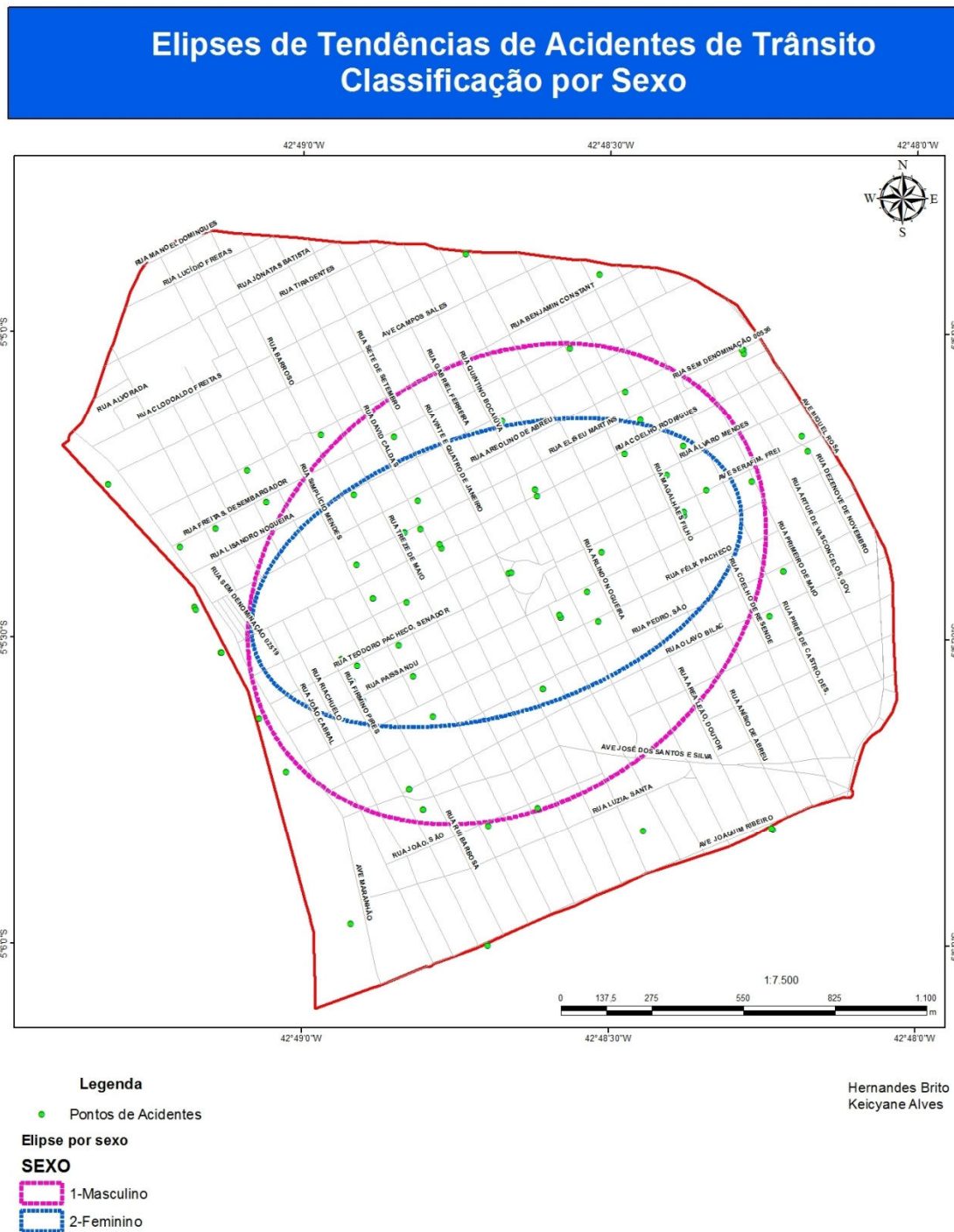
Figura 2 – Elipses de tendência de acidentes de trânsito, classificação por sexo.

Na figura 2 são apresentadas as elipses criadas a partir do sexo dos envolvidos nos acidentes. Através das elipses é possível perceber que os homens, representados na figura pela elipse rosa, estão em maior número e mais espalhados que as mulheres, indicando assim que os homens são as maiores vítimas em acidentes de trânsito, somando 46 vítimas.