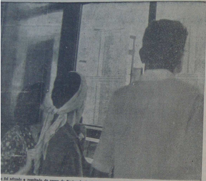
Foi afixado o resultado da prova de Português da Universidade Federal de Pernambuco, os feras acorreram para saber se tinham passado ou não